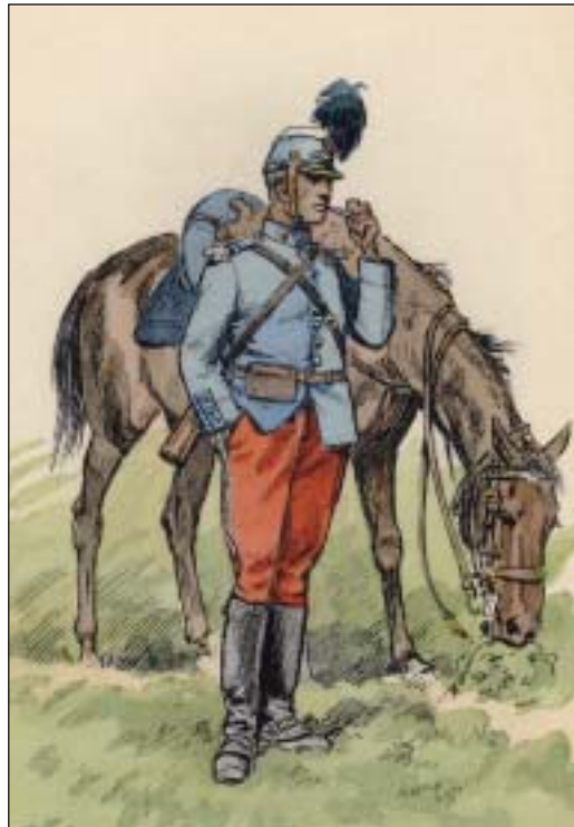
Cavalier du 2 e Hussards en 1914. Dessin original de Maurice TOUSSAINT

violent à la lance contre les cavaliers du 3 ème escadron du 7 ème Chasseurs à cheval allemand de Trèves.