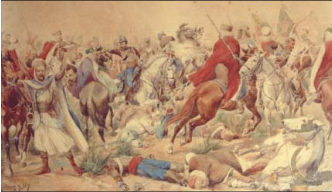
Combat de Sidi Brahim - Salle d'honneur du 2e Hussards - Sourdun

Dès qu'il eut organisé sa colonne, au mois d'août, Bugeaud avec sa petite armée de 8000 hommes, se porta à la rencontre de l'armée marocaine, forte de 60000 cavaliers à Isly.