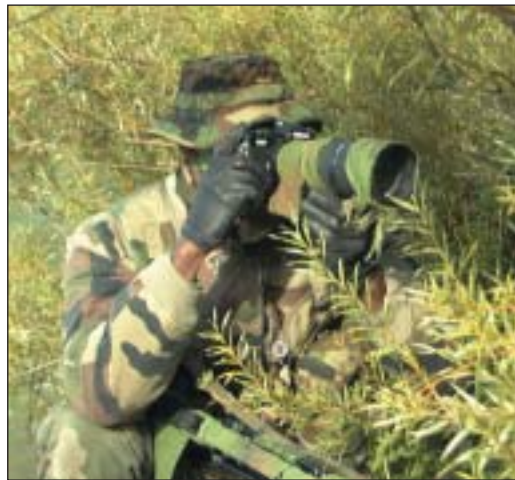
Hussard en action de renseignement photographique.

lique étant la disparition progressive des AMX 10 RC au profit des VBL, en 1999, puis définitivement fin 2001. Compte tenu de leur mobilité tactique limitée et de leur puissance de feu excessive, les AMX 10 RC n'étaient plus vraiment adaptés aux missions du régiment et affectaient la crédibilité du nouveau concept.