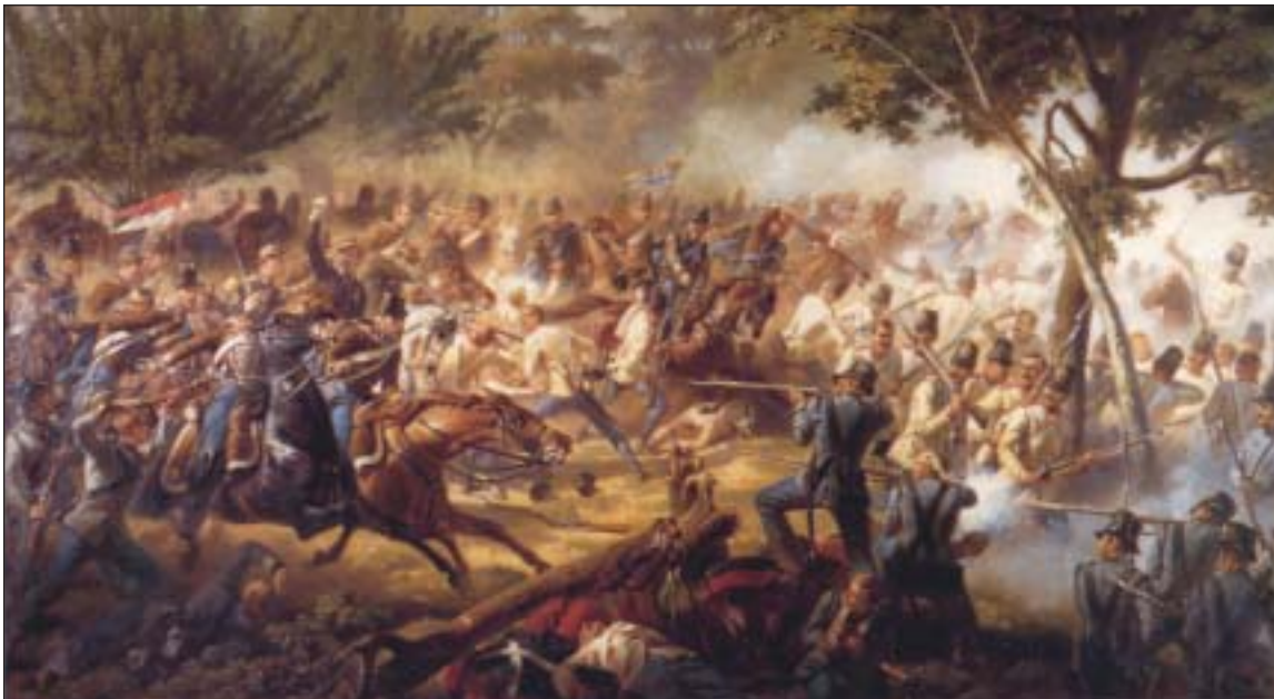
Charge du 2e Hussard à Solferino - Huile sur toile de A-Louis Janet - Salle d'honneur 2e Hussards - Sourdun

Conduite avec beaucoup d'entrain cette charge est un plein succès; bon nombre d'Autrichiens sont sabrés, les autres lâchent pied et l'infanterie française soulagée peut reprendre l'offensive.