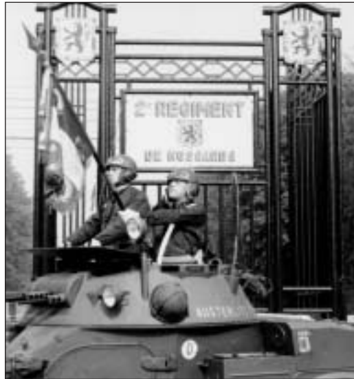
Etendard du 2 e Hussards à l'entrée du quartier Sonis à Orléans. Le régiment fut équipé d'AML à partir de 1962. Collection salle d'honneur 2 e Hussards.

BUGEAUD I, comprenant la relève des disponibles, le nouveau centre fournit un sous-officier et vingt-six hussards au 24 ème Dragons, ainsi que soixante-quinze cavaliers au 25 ème Dragons et au 9 ème R.I.C.