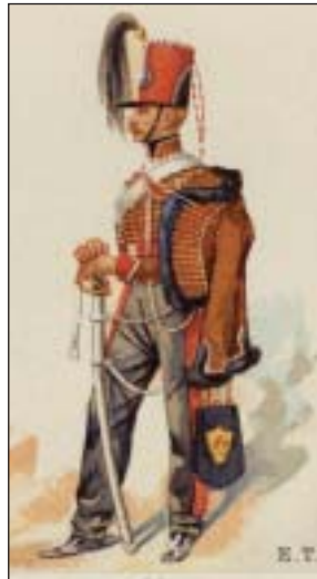
Hussard de la Meurthe - 1820 Dessin original d'Eugène Titeux

Dès 1816, on forma de nouveau six régiments de hussards: le 2 ème fut constitué à Metz le 26 janvier, et prit le nom de