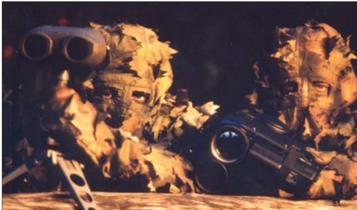
Eléments d'une patrouille de recherche avec sa caméra thermique (vision nocturne) en observation.

Pendant ce temps, au régiment le travail de mutation se poursuivait avec la mise sur pied du Centre d'Instruction Spécialisé Recherche (CISR) , la rédaction des procédures opérationnelles, la