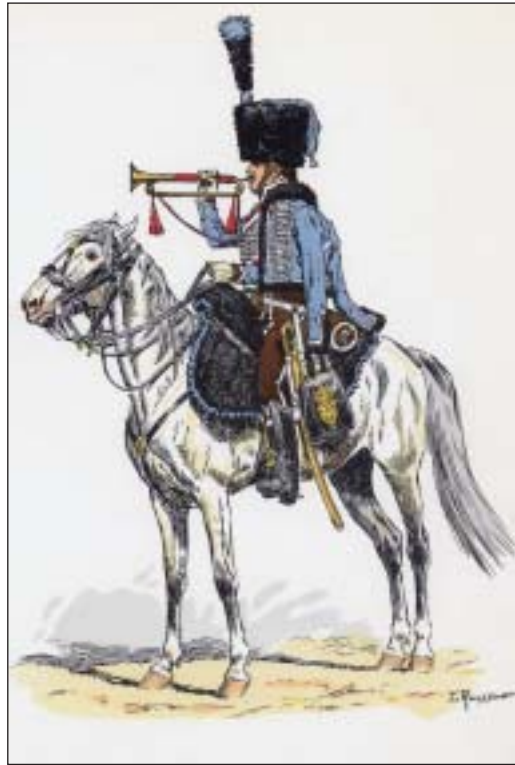
Trompette du 2 e Hussard en 1808. Dessin de L. Rousselot

Il n'y avait plus d'armée prussienne, mais à l'Est, la menace russe grandissait. En 1807 s'ouvrait la campagne de Pologne. Le climat et le terrain allaient la rendre particulièrement rude : les chemins étaient défoncés, le pays, désert et marécageux, n'offrait aucune ressource, il y avait une telle boue que plusieurs fois, on allait être contraint de charger au pas. Malgré tout, les Chamborant parviennent à se distinguer. Le 3 janvier, entre autres, leur colonel ravitaille la cavalerie en enlevant les fourrages de l'armée russe qu'il ramène aux cantonnements français dans 90 voitures. Le 20 janvier 1807, une reconnaissance sauve toute l'armée en éventant la marche de l'adversaire.