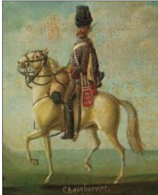
Hussard de Chamborant, vers 1776, huile sur toile. Musée de l'Armée - Paris

En 1786, la tenue des Chamborant était la suivante : pelisse et dolman brun marron, parements retroussés de drap garance, culotte bleu céleste, bordée de ganses