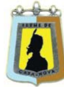
Deuxième modèle de l'insigne du 5e Escadron. Le premier modèle portait à sa base la silhouette d'un AMX 10 RC. Cet insigne est actuellement porté par les réservistes du 5e Escadron.