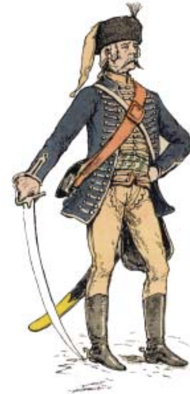
Hussard d'Esterhazy en 1735.

En 1739, Esterhazy Hussards fait ses premières armes en Corse pour venir en aide à la République de Gênes confrontée à une révolte de la population. Le régiment y enregistra ses premières pertes dans la nuit du 18 au 19 mai 1739 à Algajola 3 , avec la mort du lieutenant de Stroh. Le régiment restera en Corse jusqu'en août 1740 et en Provence d'août 1740 à mai 1742 4 .