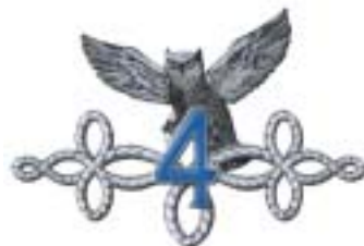
Insigne du 4 e Escadron.

LASSALLE (Intendant général Jean de), «Les insignes du 2 ème Hussards et des unités qui en sont dérivées», dans la revue Vivat Hussar , Tarbes, n° 16, 1981.