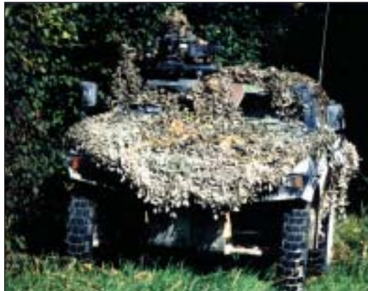
VBL du 2e Hussards

Pendant tout ce temps le régiment poursuivait la formation de son personnel, mettant l'accent sur la formation physique et morale afin de disposer d'hommes robustes capables d'agir dans la profondeur et l'isolement le plus total, la formation technique et tactique afin de développer l'aptitude à mettre en œuvre des procédés ou procédures spécifiques propres aux missions de renseignement.