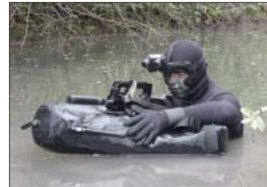
Hussard de la patrouille nautique du 3e Escadron.