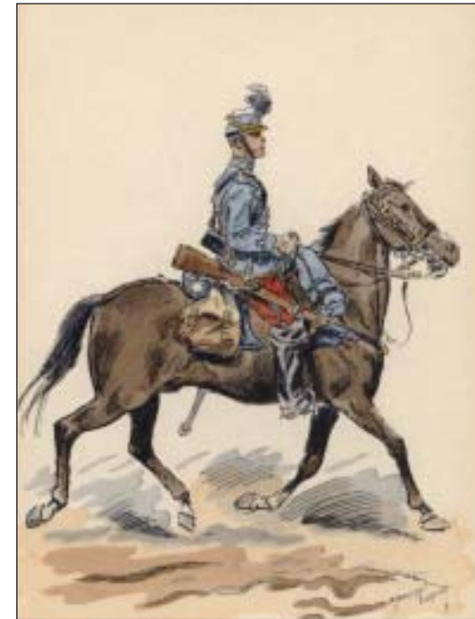
Cavalier du 2 e Hussards en grande tenue, au début de la III e République. Dessin original de Maurice TOUSSAINT

Le 2 ème Régiment de Hussards retourna en Algérie de 1880 à 1887, puis vivra jusqu'en août 1914 la vie quotidienne et paisible des régiments d'avant-guerre. Petites villes regorgeant de troupes: Melun, Senlis, Verdun, Lunéville, et les autres garnisons de l'Est. Périodes toutes