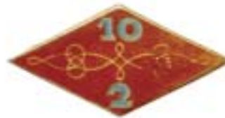
Insigne de l'amicale des 2e et 10e Hussards (porté de 1921 à 1939).

Le 1er août 1921, à Versailles, le 2ème Régiment de Hussards est dissout et recrée le même jour à Tarbes avec les éléments du 10ème Hussards