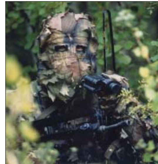
Hussard en situation d'observation d'objectif.

quelque 130 VBL répartis en plus d'une cinquantaine de patrouilles qui auront une capacité d'emport d'équipements échantillonnaires mais à haute valeur ajoutée permettant d'acquérir des informations sur différents supports tels que la photo numérique ou argentique, la vidéo, à des distances importantes et de les transmettre au bénéficiaire approprié, selon des moyens de transmissions diversifiés.